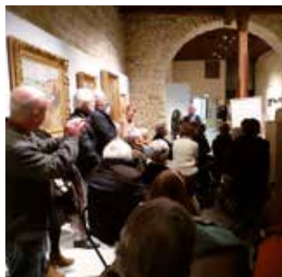
↑ Conférence autour d'une exposition du musée des beaux-arts, La Cohue

Vous aimez les musées et souhaitez entretenir vos connaissances et votre intérêt pour la culture : faites de belles rencontres avec les amis du musée de Vannes passionnés d'art contemporain.