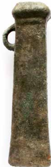
↑ Hache à douille du dépôt de Plumergat

En 2022, les propriétaires juridiques acceptent d'en faire don, et les haches bénéficient d'un nettoyage au laboratoire Arc'Antique (Nantes) avant d'intégrer les collections du musée. L'usage de ces objets est encore incertain : la fonction de lingot prémonétaire est envisagée.