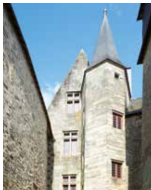
↑ Vue extérieure du Château Gaillard

Actuellement fermé pour travaux, le musée d'histoire et d'archéologie réalise un diagnostic sanitaire de son bâtiment, avec l'ambition à terme de le restaurer et de l'aménager pour le rendre accessible à tous.