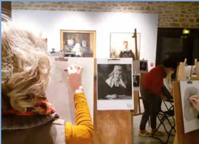
↑ Atelier dessin au musée