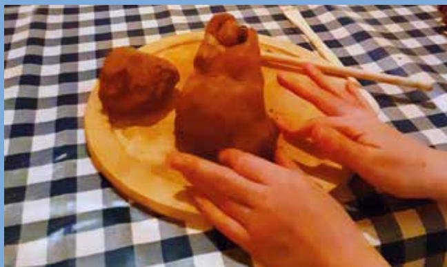
↑ Atelier modelage