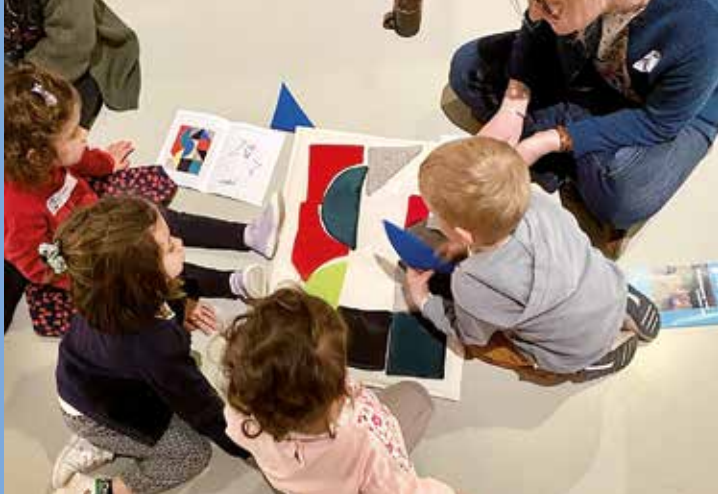
↑ Animation des couleurs sens dessus-dessous

Apprentis artistes, enquêteurs, amateurs d'histoires, tous les enfants sont bienvenus au musée des beaux-arts de Vannes. Une multitude d'activités les attend selon les âges, de 3 à 16 ans, pour répondre à leur soif de curiosité et de créativité.