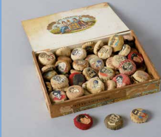
↑ Mariano Otero, Boîte de jeu © Musées de Vannes

Tarif : 6 € tarif adulte / 4 € tarif enfant (à partir de 6 ans).