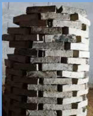
↑ Maquette préparatoire des tours de l'exposition V.A.S.E.