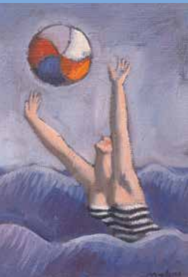
↑ © Mariano Otero, Sans titre , 1991, huile sur toile © Musées de Vannes