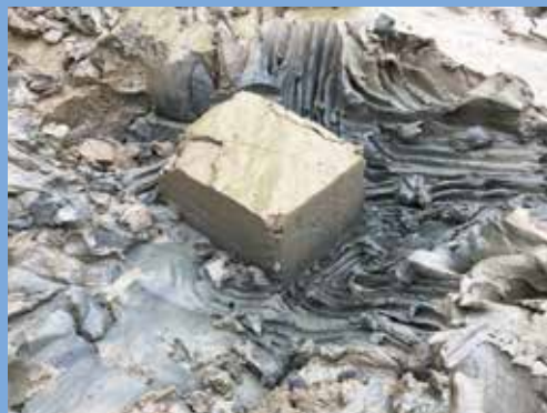
↑ Carré de vase

Rendez-vous au CIAP de 14h à 18h - Gratuit. Réservation recommandée au 02 97 44 52 02. Ciap-limur@gmvaggio.bzh