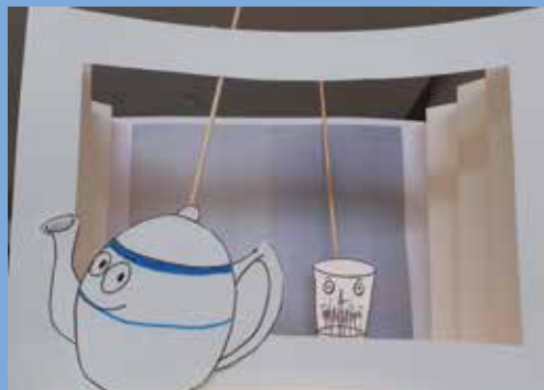
↓ Maquette de l'atelier « Mon petit théâtre d'objets »