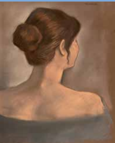
↑ Mariano Otero, Eva , 2017, pastel sur papier

Débutants ou amateurs, les ateliers du musée permettent à chacun d'explorer avec l'œil, les œuvres et avec la main, une pratique. Entre observation des peintures et invitation à la création, le musée regorge de propositions artistiques pour votre grand plaisir.