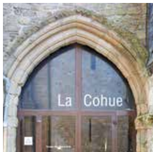
↑ Porte d'entrée du musée des beaux-arts, La Cohue

Au XV e siècle, une salle haute où se tiennent les cours de justice du Duc est construite perpendiculairement au rez-de-chaussée. Elle conserve aujourd'hui ses deux grands murs pignons avec les baies d'origine et les bancs de pierre, dans les embrasures. Cette salle aux belles proportions accueille le parlement de Bretagne, exilé à Vannes entre 1675 et 1690. Sous la Révolution, elle abrite le tribunal avant que le théâtre municipal ne soit installé de 1796 à 1940 environ. La façade vétuste de La Cohue, côté rue des Halles est renouvelée en 1819. La Ville entreprend d'importants travaux sur ce bâtiment, diversement utilisé jusqu'en 1980 afin d'y établir le musée des beaux-arts. Ce dernier ouvre ses portes en 1982.