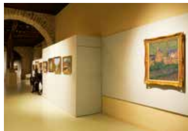
↑ Salles des collections permanentes, musée des beaux-arts, La Cohue

Tout le programme d'activités autour des collections dans les pages «Rendez-vous».