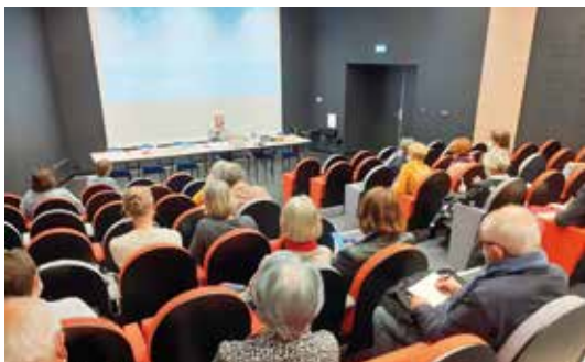
↑ Conférence autour d'une exposition du musée des beaux-arts, La Cohue.

Vous aimez les musées et souhaitez entretenir vos connaissances et votre intérêt pour la culture : faites de belles rencontres avec les Amis du musée de Vannes passionnés d'Art Contemporain.