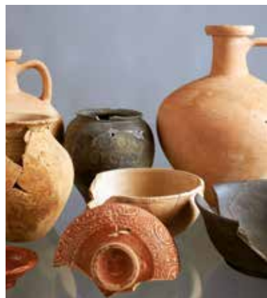
↑ Collection de vases antiques du musée d'histoire et d'archéologie

Dès sa création en 1826, les érudits de la Société polymathique du Morbihan œuvrent dans la collecte de spécimens naturels issus du département, en particulier des plantes pour la constitution d'herbiers. À partir du milieu du XIX e siècle, une nouvelle génération de savants s'investit dans la recherche archéologique, de manière collégiale et méthodique. Entre 1850 et 1914, ils explorent ainsi plus d'une centaine de sites ou de monuments, toutes périodes confondues, et mettent au jour des milliers d'artefacts (céramiques, outils en pierre ou en métal, armes, bijoux, monnaies, ...). En parallèle, le fonds s'enrichit d'innombrables objets anciens trouvés isolément ou rapportés du monde entier, notamment d'Océanie, ainsi que de témoins des civilisations méditerranéennes (Carthage, Grèce, ...). L'archéologie régionale représente un ensemble incontournable de plus de 6 000 objets, auxquels s'ajoutent autant de monnaies et médailles et près de 2 000 pièces historiques, ethnographiques ou extra européennes. Les sciences naturelles comprennent plus de 10 000 plantes, 10 000 coquillages, 6 000 minéraux et fossiles, 800 animaux naturalisés, ... Au total, en près de deux siècles, plus de 40 000 éléments sont ainsi réunis, toutes collections confondues, et forment un ensemble patrimonial exceptionnel à l'échelle régionale.