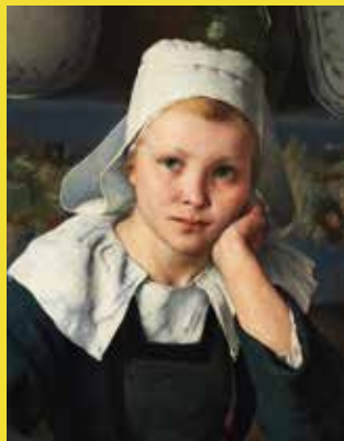
→ Détail du tableau de Flavien-Louis Peslin, Jeune bretonne , 1885, huile sur toile © Musées de Vannes

Les mercredis 15 février et 1 er mars à 10h Durée: 2h Tarif: 10 € plein tarif 7 € tarif réduit.