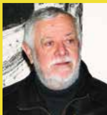
↑ Yves Coppens ©Musées de Vannes