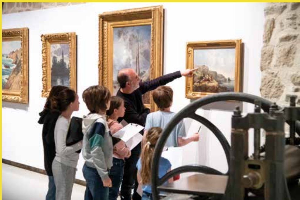
↑ Animation «Le secret de la Goélette» © Musées de Vannes