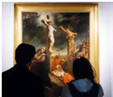
↑ Vue de l'espace de présentation du tableau.

Le Christ sur la croix , peint par Eugène Delacroix en 1835, considéré comme la première grande crucifixion de l'artiste, est l'œuvre emblématique de la constitution de la collection.