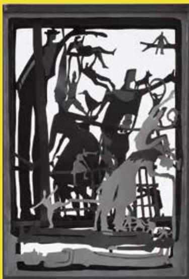
→ Boîte Généalogie I , 2013, Corinne Véret-Collin, métal, acrylique et bois © Musées de Vannes © Adagp, Paris, 2022

Tous les dimanches de 13h30 à 18h. Gratuit pour tous.