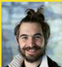
↑ Thomas Daveluy ©Musées de Vannes