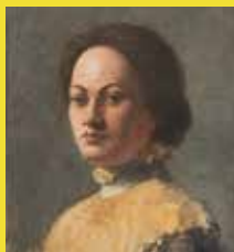
← Jeanne-Marie Barbey, Autoportrait, vers 1900, huile sur toile