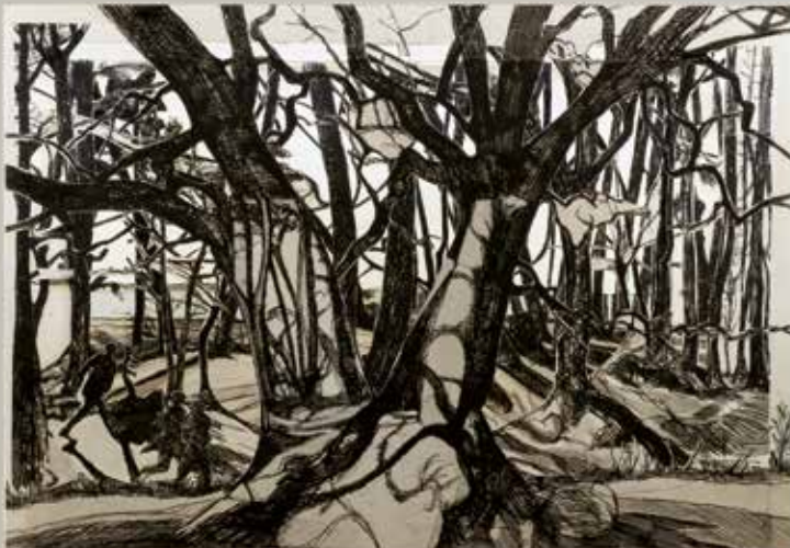
→ Promenade à Conleau, boîte-tunnel 2022. œuvre commune à quatre mains Corinne Véret-Collin et Pierre Collin Eaux-fortes, découpes, collages, reprises à l'encre et mise en volume, 51 x 75 x 91 cm. © Adagp, Paris, 2022