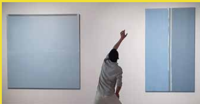
← Danse. Tristan du cours Charmey