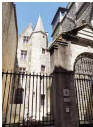
↑ Vue extérieure du Château Gaillard

Château Gaillard, la plus vieille demeure de Vannes, est un hôtel particulier daté du XV e siècle, construit en pierre à l'époque où le reste de la ville est en pan de bois. Cette demeure urbaine médiévale a été bâtie par Jean de Malestroit, chancelier du duc Jean V de Bretagne (1408-1442), sur une ancienne propriété d'un certain Gaillard Tournemine. En 1457, le duc Pierre II achète l'immeuble pour servir d'auditoire au parlement de Bretagne et de demeure pour le président du présidial. En 1912, Château Gaillard est acheté par la Société polymathique du Morbihan qui y installe le musée archéologique.