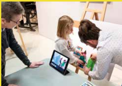
← Atelier film d'animation