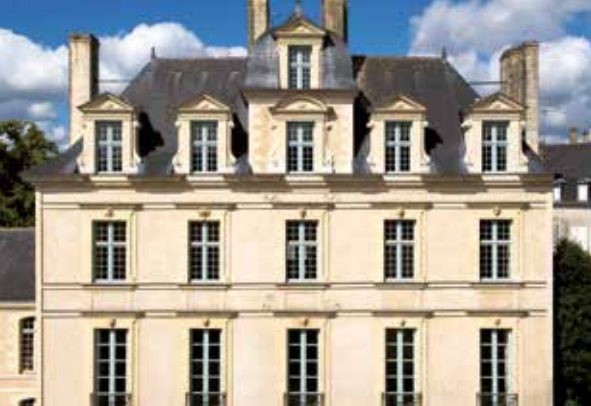
Hôtel de Limur