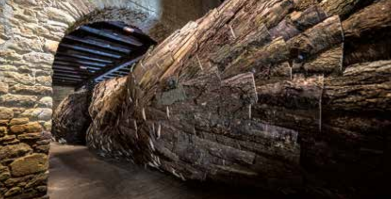
Intrant, Simon Augade