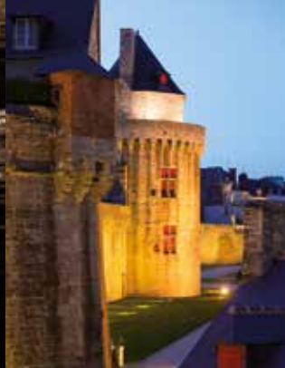
La Tour du Connétable