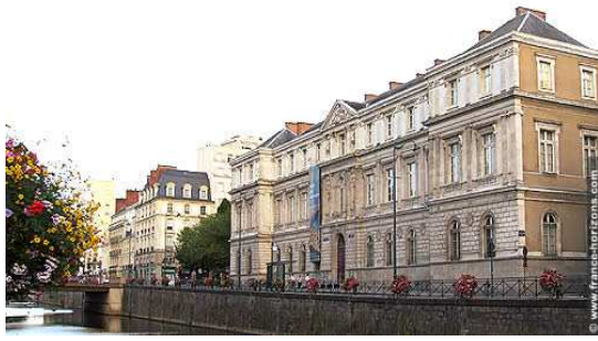
Le musée des Beaux-arts de Rennes dont l'association d'amis compte 600 membres.