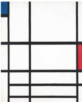
Piet Mondrian, Composition en rouge, bleu et blanc II , 1937 © Mondrian / Holtzman trust, coll. Centre Pompidou, RMN