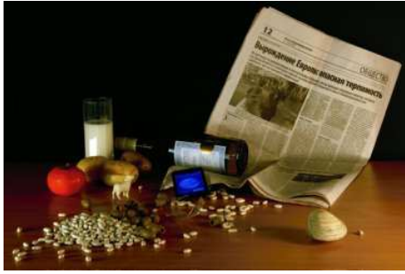
En haut, Thierry Le Saëc, 2010, en bas, Olga Kisseleva, Divers faits, 2010

Divers faits, Olga Kisseleva, à la Criée, à Rennes. Cette exposition est accessible grâce au lien ci-dessous (sur votre clavier : contrôle + clic) http://www.criee.org/DIVERS-FAITS?periode=En-ce-moment